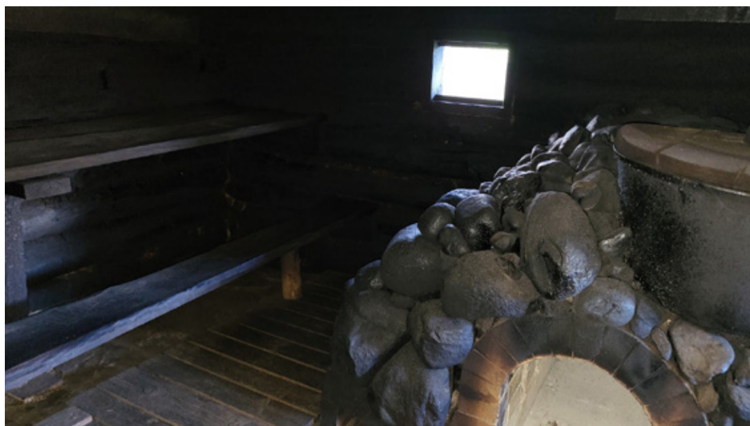
Kuhikeressega suidsusann Võromaal.

Loendusuurmisõst joba korjunu ja viil mano tulõva tiidmise tollõ kotsilõ, ku tähtsä om suidsusann mi elokõrraldusõn, saami edesi anda ummilõ latsilõ ja latsõlatsilõ. Õnnõ ütetaolidsõmbas muutuvan ilman om