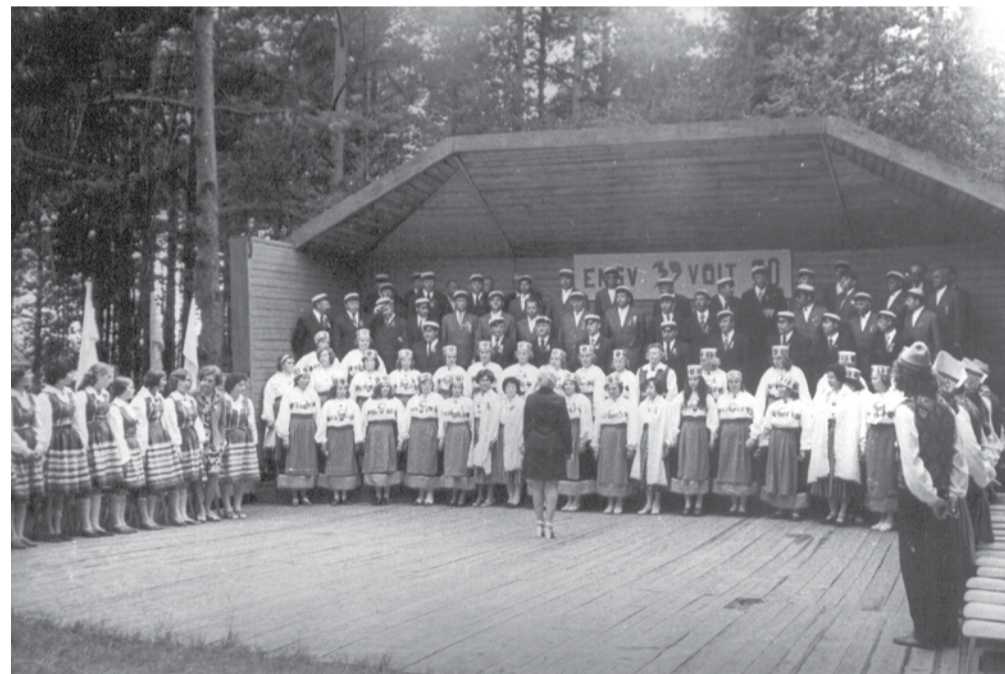
Foto ja negatiiv. Misso laulupäev 1975.a. suvel. Võrumaa Muuseum VK F 1558:157F

Laulupidusid Misso on peetud ammu ajast. Enne laululava valmimist Pullijärve ääres olid laulupidud järvesaarel – esmalt tuldi kokku Pullijärve teisel kaldal, koolimaja taga, hiljem oli uus peoplats juba keskusele ja uuele kultuuri-