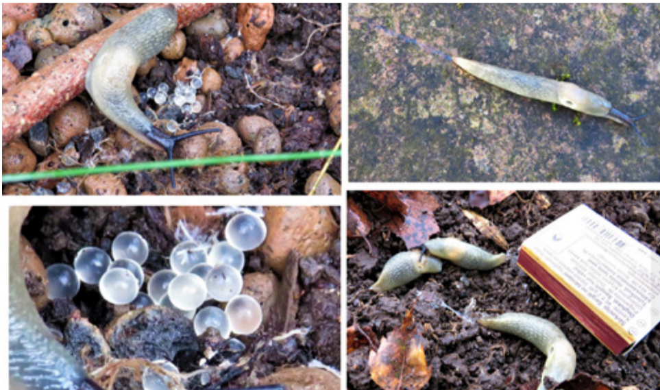
Mustpeanälkjast ja tema munad. Mustpeanälkjast ei sarnane ühegi meie kodumaise teeliigiga.

Juhised hispaania teeteste ja mustpeanälkjast hoidumiseks ning nende tõrjumiseks leiab Keskkonnaameti