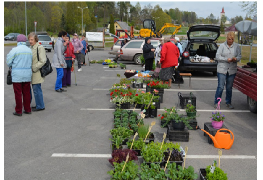
Fotomälestus kümne aasta tagusest kevadisest taluturust Ala-Rõuges.