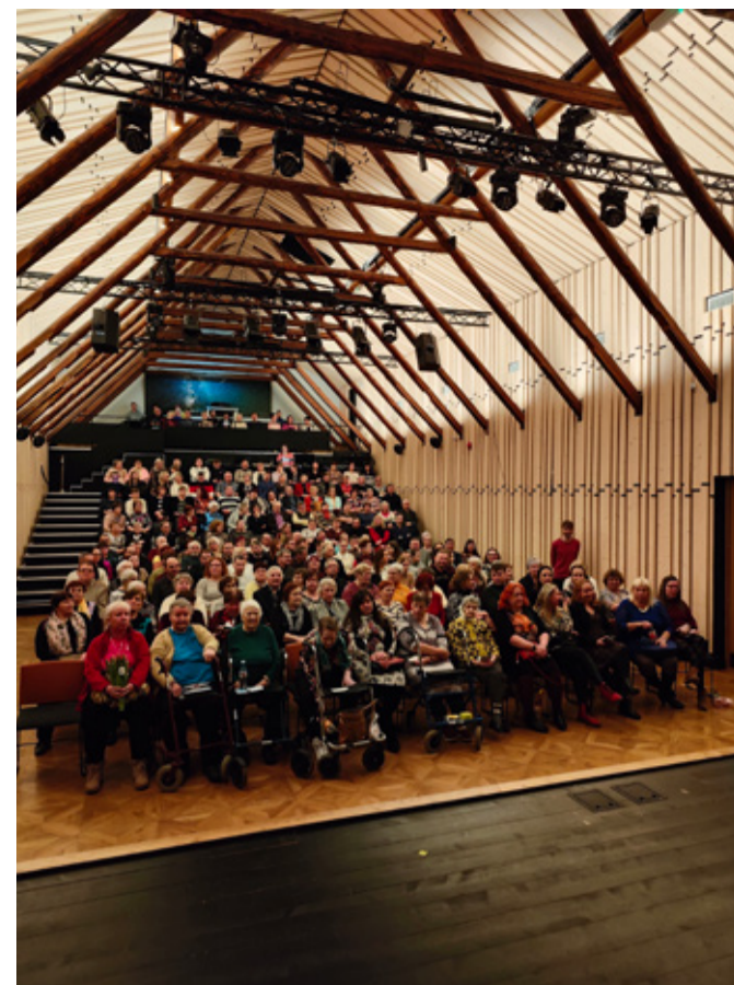
See oli teatrikuu tipphetk Rõuge rahvamajas – 200 inimest saalis ning isegi rõdu oli täis.