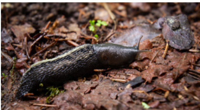
Must seatigu on kodumaine teeliik. Tunned kasuliku liitlase ära sõrmelähe mustri järgi mantlikilbil. Foto: Margit Turb

veebilehelt: https://keskkonnaamet.ee/voornalkjad .