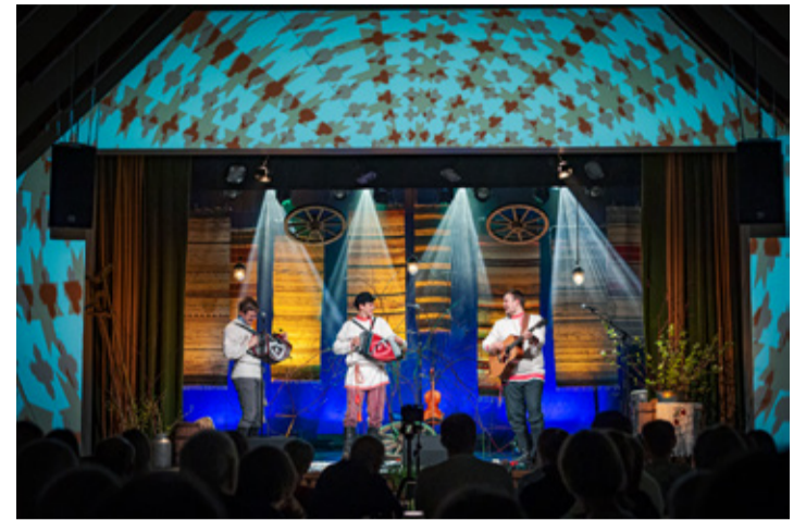
Hariliku Kiiora tantsumõllu asemel oli tegu kuulamiskontserdiga, vaheldusrikka ja läbimõeldud kavaga, aga siiski klassikalise igasse ilmakaarde pritsiva energiaga.