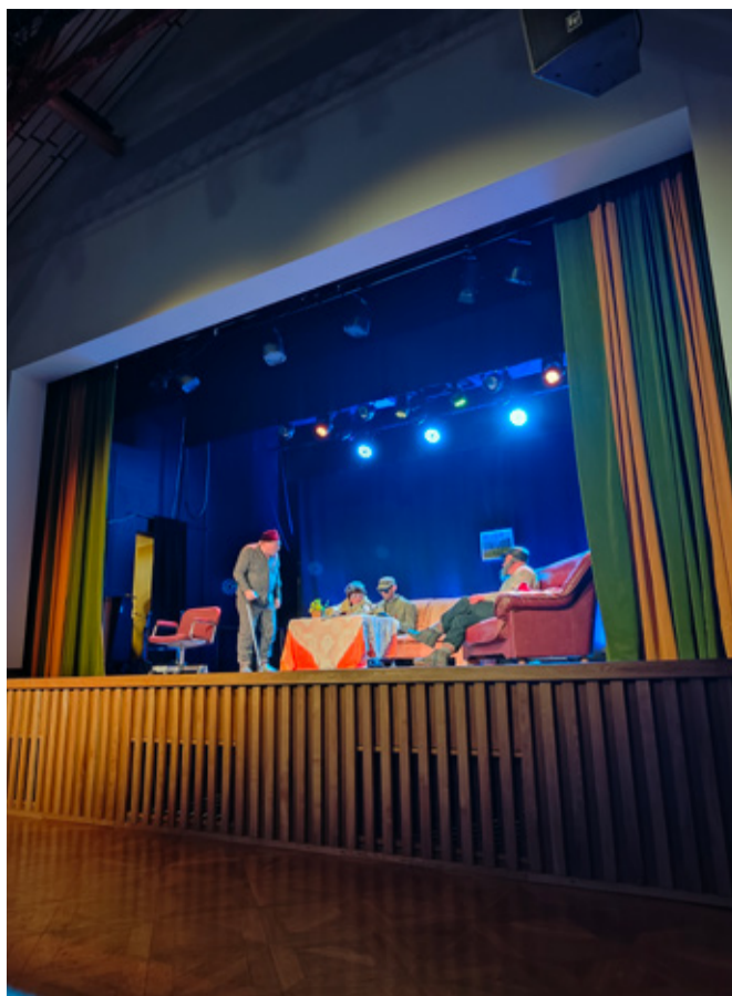
Etenduse „Kae kos pandse plõnni“ ajal rõkkas publik naerust kogu 50 minuti vältel.