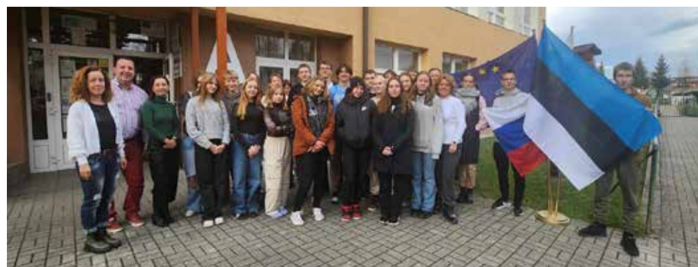
Haanja kooli ja Rabča kooli õpirändes osalejad.