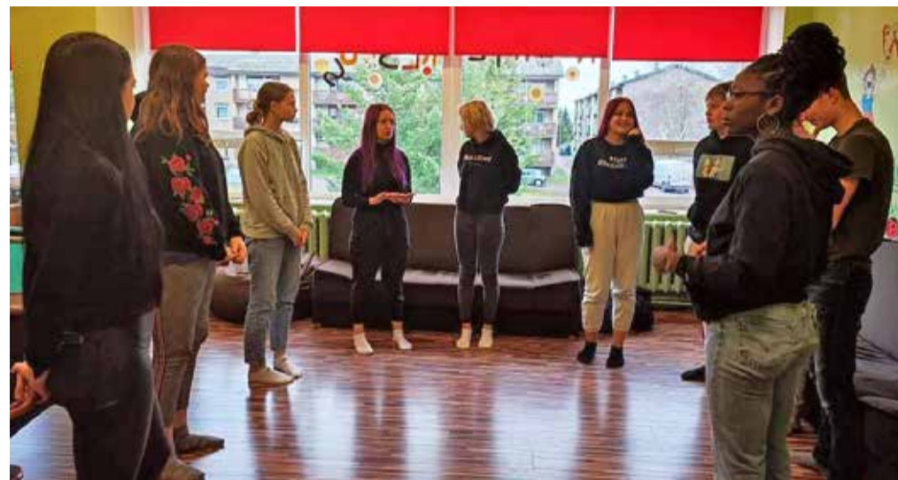
Rõuge noortevolikogu ja Väike-Maarja noortevolikogu mängivad tutvumismängu.

Mariann Toots Haanja piirkonna noorsootöötaja