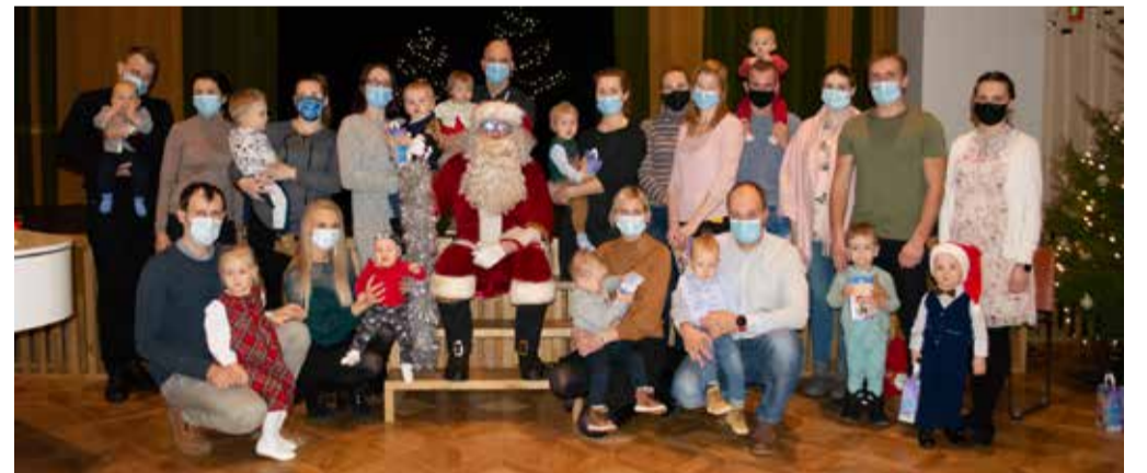
14. detsembril toimus Rõuge valla koduste mudilaste jõulupidu Rõuge rahvamajas. Pildil on kõik pisikesed peolised oma vanematega.

Lisainfo: 526 1829, hannalastekaitse@rauge.ee (lastekaitse spetsialist Hanna Loore Marjeta Salumäe).