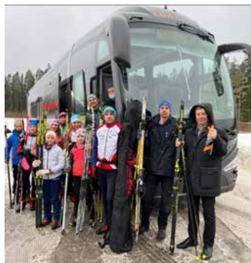
Esimene suusabuss jõudis Haanjasse 17. detsembril.