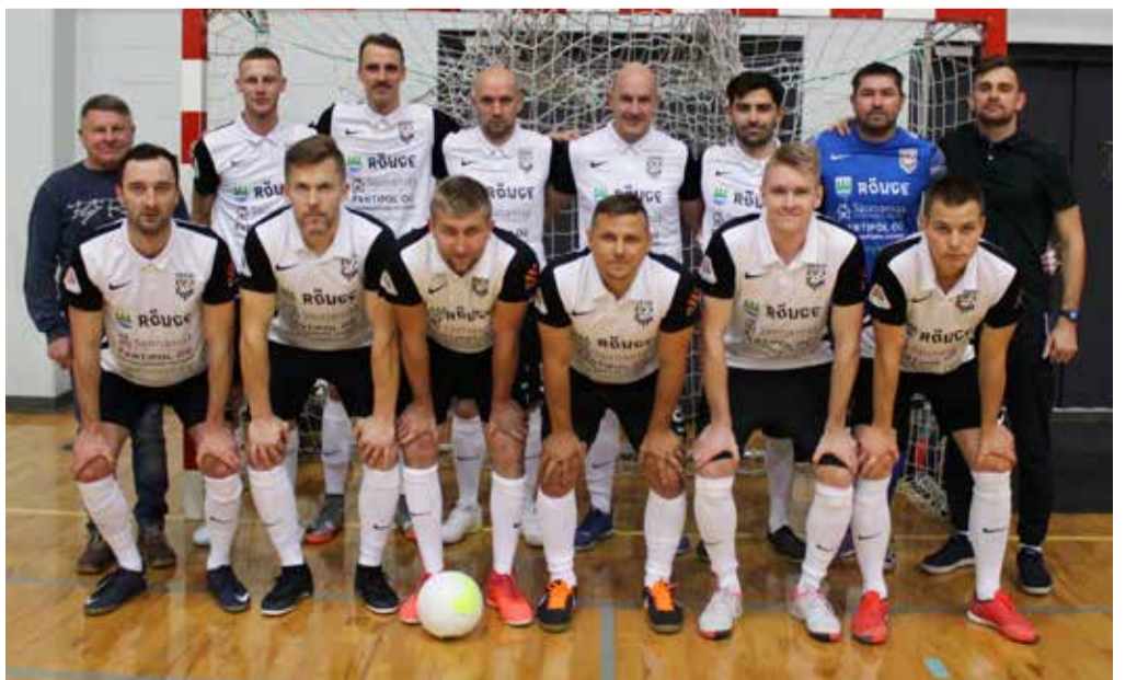
Rõuge Saunamaa meeskond.

3:8 Eesti hõbeda võistkonnale Tartu Ravens Futsal. Teises mängus võideti JK Kohilat 4:2.