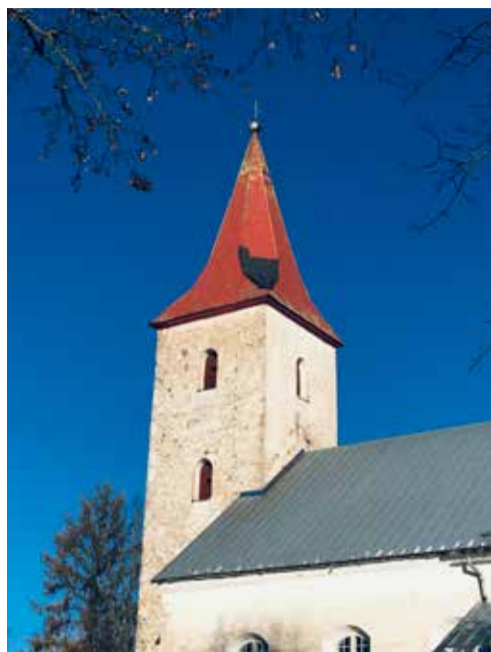
Rõuge kiriku torni tipus peaks 2022. aasta sügisel olema risti asemel tagasi vana ajalooline restaureeritud kupp.

Õnnistatud peatselt algavat adventiaega soovides, Indrek Hunt juhatusel liige Rõuge Maarja kogudus