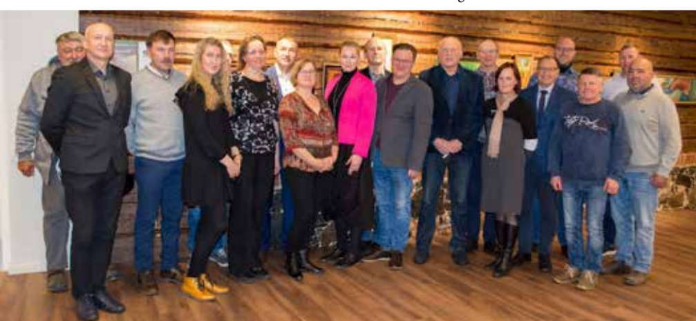
Rõuge vallavolikogu teine koosseis pärast esimest istungit.