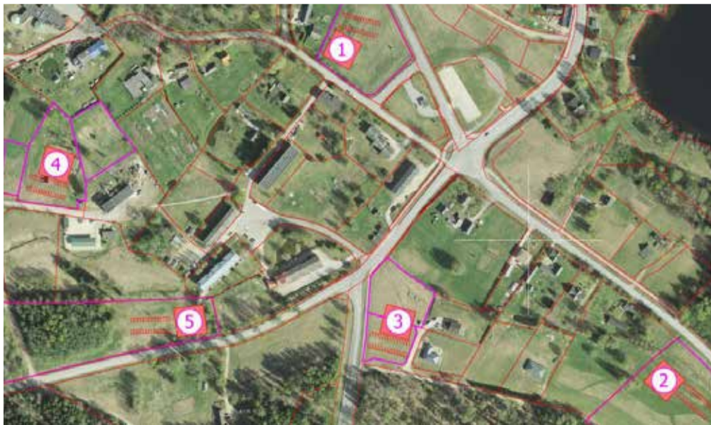
Rõuge kaubanduskeskuse võimalikud asukohad. Väljavõte Rõuge kaubanduskeskuse kohaanalüüsist