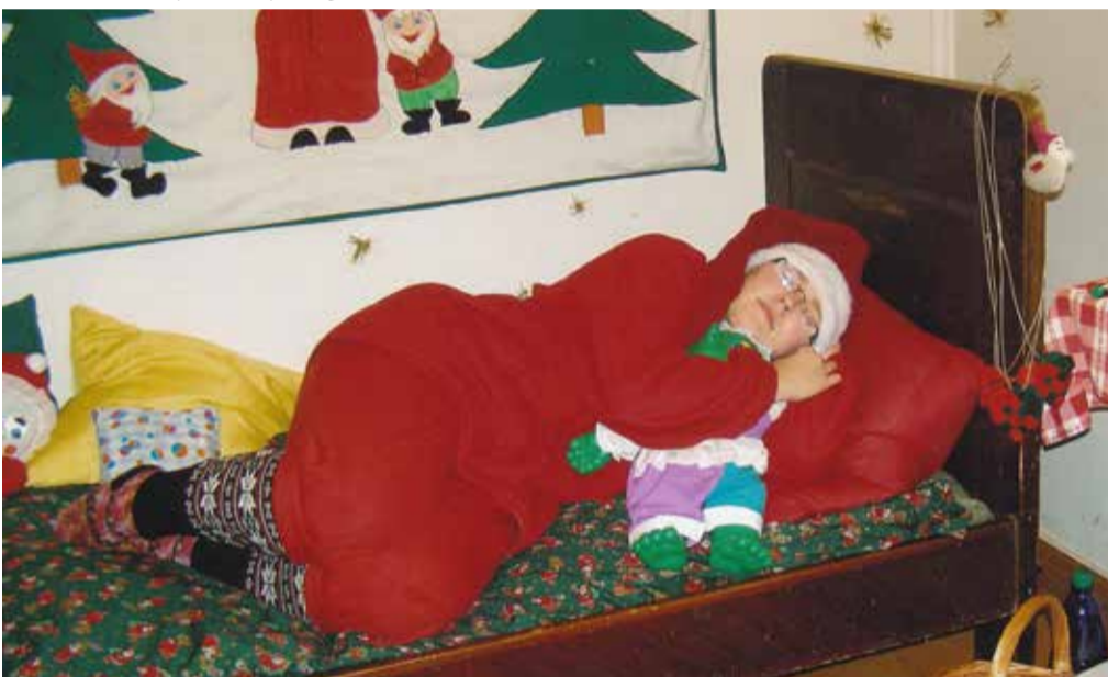
Veel on veidi aega... Foto: Mõniste Taluraha muuseumi fotokogu/ Päkapiikumaa 2001.a.