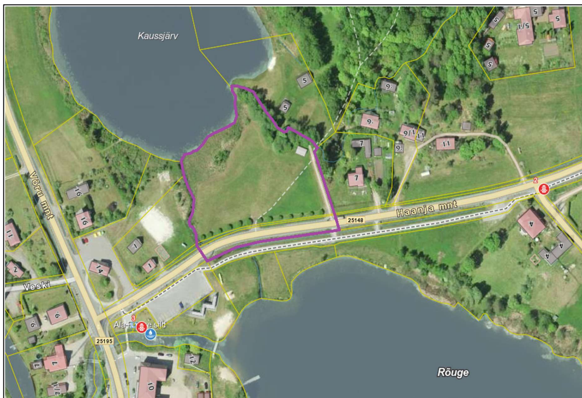
Joonis 2 Väljavõtte Maa- ja Ruumiameti Geoportaali kaardirakendustest Ohtlikud käitised, veevarustus, veeohutus

Ehitiste väline tuletõrjevee varustus tagatakse Haanja mnt 2 ning Haanja mnt ja Ööbikuoru tänavate ristmikul asuvatest hüdrantidest (Joonis 2 Väljavõtte Maa- ja Ruumiameti Geoportaali kaardirakendustest Ohtlikud käitised, veevarustus, veeohutus). Mõlemad hüdrandid asuvad planeeringualale lähemal kui 200 m.